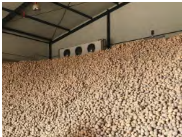
Almacén con patata almacenada a granel: control de brotes eficaz con Biox-M® .

Biox-M® debe ser aplicado solo por empresas especializadas y con la maquinaria adecuada.