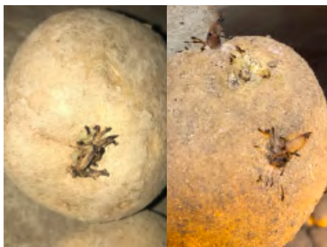
Efecto del quemado de brotes con la aplicación Biox-M® .