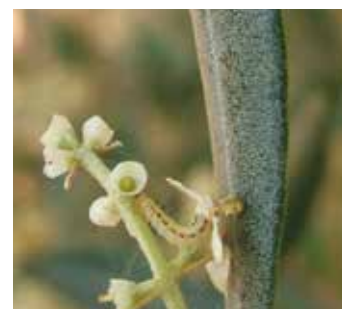
Foto detalle de Prays oleae